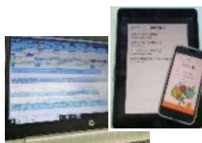
▲パソコン、タブレット、スマート フォンによる介護記録ソフトの使用