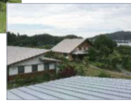
▲診療棟から眺めるサービス棟