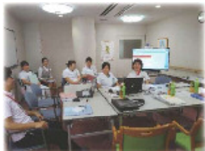
▲日本医療機能評価機構受審を控えた看護部門

【認定シンボルマーク】 一定の水準を満たした病院は「認定病院」となり、「認定シンボルマーク」が発行されます