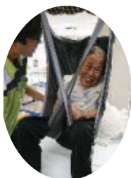
▲リフトを使って安心安全な移乗を行ないます

最後になりますが、本年も皆さまにとつて明るく良い年でありますように祈念申し上げます。