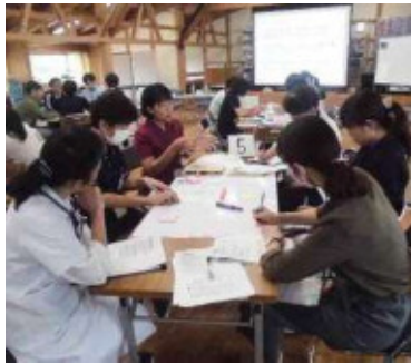
▲入退院支援事業 運営メンバー会議の様子

年度末に向かい、今取り組ん でいる入退院支援事業でも、当 院独自の入退院支援可視化シ フトが作成されました。事例を通 して評価を行ない、次年度はス タッフが現場で使用し、より先 鋭化していく過程に入ります。 で、さらに院内だけではなく急 性期病院や地域と同じ方向を見 て、多職種が協働できる体制を 構築していきます。