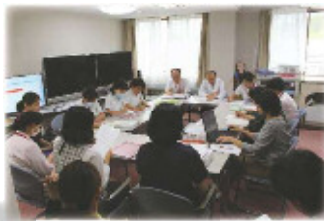
▲日本医療機能評価機構受審にむけて多職種で会議を重ね、臨みました