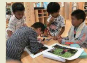
▲プリント学習の様子