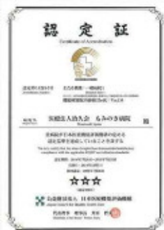
【日本医療機能評価機構認定証】

厳しい勤務環境に置かれている医師や看護師をはじめとする多くの医療従事者が、健康で安心して働ける職場環境の整備は、質の高い医療の提供や医療安全の確保などを図る上でも、極めて重要です。そのため「職員みんなが生き生きと働き続けられる職場」を目指し、職場環境の整備に取り組んでいきます。そして、もみのき病院は、地域に根差した医療機関として、病院組織の一人ひとりが医療の質改善に取り組んでいきます。