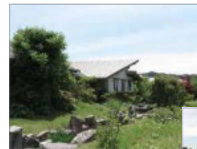
▲木々に囲まれる南病棟

今後も地域との繋がりを大切 にし、有事にも対応できる医療 機関でありたいと考えています。