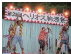
▲ヘリオス納涼祭の様子

火災訓練、南海トラフ地震対策、水害土砂災害対策など年間を 通じて訓練を実施していきます。