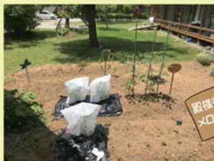
ネットで覆われるメロン。他の野菜が嫩殖する、まさに「えこひいき」(笑)。

かけています。収穫後の試食会を楽しみに偏りの愛をささげます。「殿様待遇栽培」と名付けています。利用者様からいただいたひまわりの苗も、窓から見える場所でも育ち速く感じながら、楽しい事への挑戦を重ね、利用者様の社会参加支援を行なっていきます！