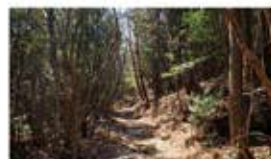
▲気持ちの良いトレイル

高知市最高峰『工石山(標高1177m)』。一度は登ったことがある方も多いのでは?