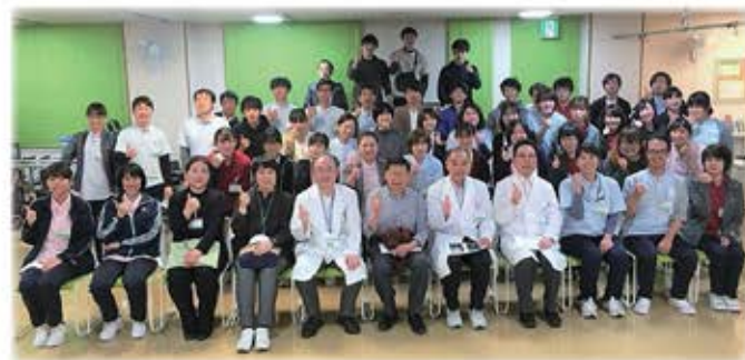
【2020年4月8日に実施されたリハ科全体会】

もみのき病院リハビリテーション科(以下リハ)科では、毎年4月にリハ科の全職員が参加し、リハ科全体会を開催しています。