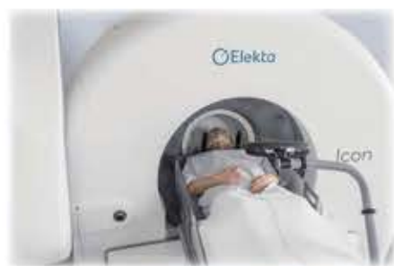
▲ガンマナイフIconの治療の様子 マスク装着▶

【マスクシステムの導入と適応の拡大】 ガンマナイフIconでは、従来の頭蓋骨にピンで固定するフレーム固定システムに加えて、ガンマナイフでは初めての専用マスクシステムを導入しています。これにより、身体に負担の少ないマスクを使つての治療が可能となったほか、分割照射による治療が容易になりました。その結果、従来の機種では治療が難しかった比較的大きな腫瘍や視神経、脳幹などのリスクの大きい部位に近い腫瘍でも安心して治療できるようになりました。