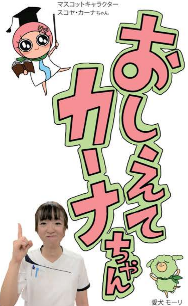
「できることからコツコツと」の巻

いえ、そうではありません。外出ができない分、屋内で役割を見つけ「生活行為」を毎日継続することで、ウオーキングの運動内容に変えることが可能です。 今回は、「生活行為」をテーマにカーナちゃんに解説してもらいましょう。