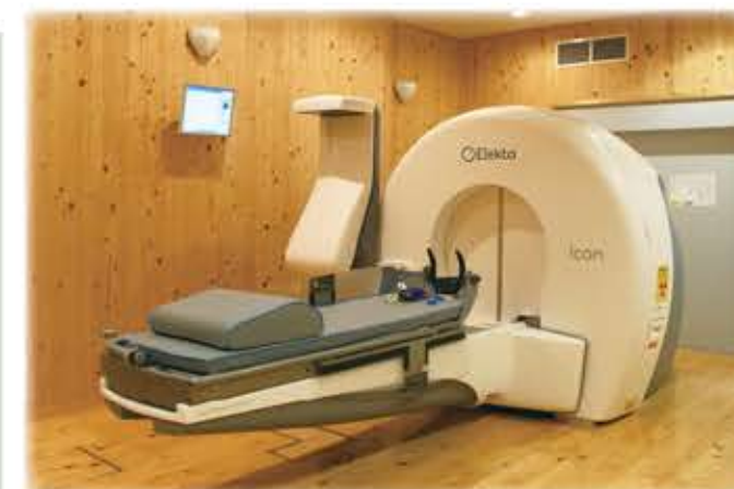
【四国初のガンマナイフ最新モデル「Icon」】 もみのき病院ガンマナイフ治療室 ※高知県産のヒノキ材で内装