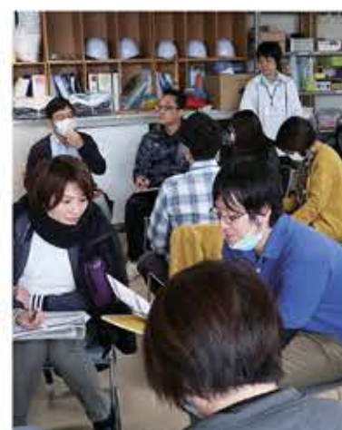
恕泉会 介護部門会

介護を必要とする高齢の方が大幅に増加する「大介護時代」を迎え、地域では一人暮らしの高齢者や高齢夫婦世帯が増え、介護の担い手不足、介護者の高齢化、それに伴う介護負担の増大が問題になっています。介護サービス事業所においても介護の担い手不足は大きな課題であり、今後、利用者様それぞれの多様な介護ニーズに対応することが困難になるのではないかと危機感を抱いています。