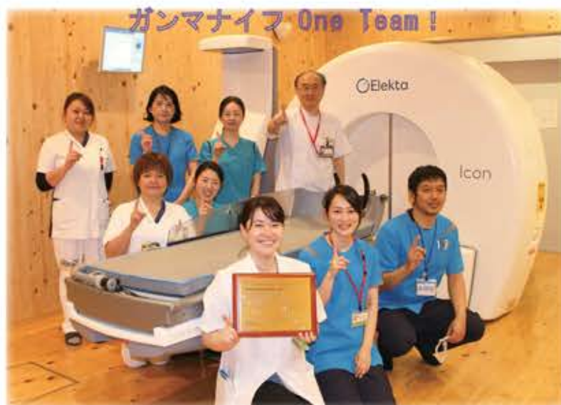
【もみのき病院ガンマナイフメンバー】