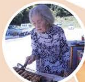
屋外でバーベキュー