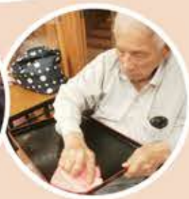
日常生活でできることを訓練中！