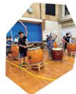
AMS(芸術・音楽・スポーツ)の授業で和太鼓を演奏

いま、教育は子どもが受け身となる授業から、子どもが主体となり自ら学ぶことを重視する、アクティブラーニングへと大きく変わってきています。本校が取り組んでいる体験重視で子どもが主体となる学習は、アクティブラーニングの実践といえるでしょう。