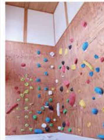
入口には子どもたちに人気のボルダリングがあります。

そんな「健康カフェとりごえ」は地域の集いの場、ふれあいの場、心に元気を与え合う場として利用していただいています。