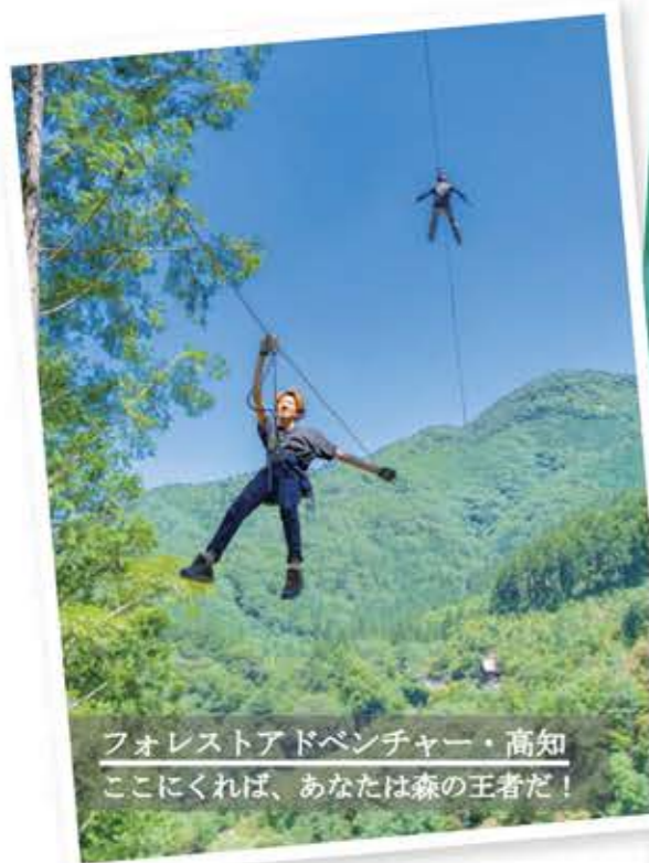
フォレストアドベンチャー・高知 ここにすれば、あなたは森の王者だ!

高知は、海・川・山の大自然と美味しい食べ物を味わえる最高の場所! その場所で人気の体験施設の割引券がついた宿泊プランだから、利用しないわけがない。高知に来たからには、是非、体験して楽しんでいてもらいたい!!! もちろん、はるの湯の温泉に浸かって、リフレッシュもお忘れなく♪