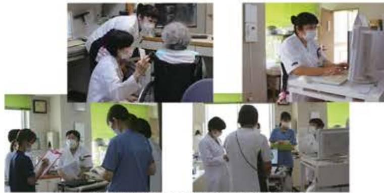
▲認知症ケアチームでのカンファレンスの様子