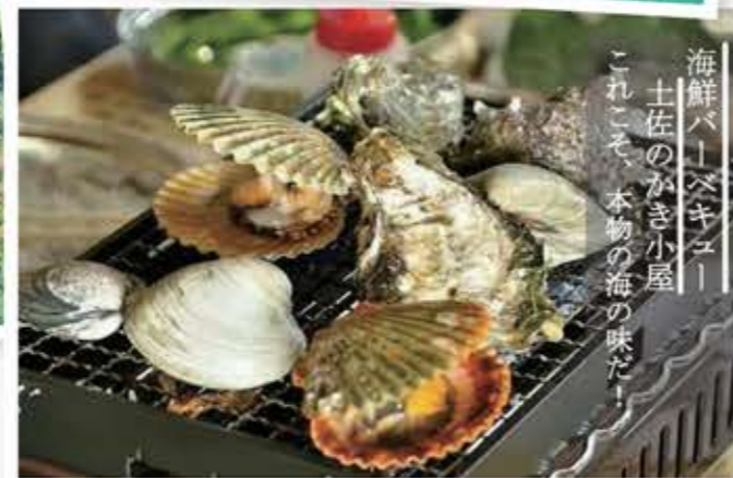
海鮮バーベキュー 土佐のがき小屋 これこそ、本物の海の味だ!

【宿泊料金】 ご宿泊人数やお部屋タイプによって料金が異なりますのではるの湯ホームページより、ご確認をお願いいたします。