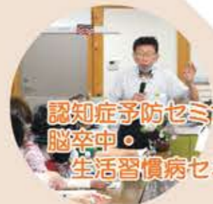
認知症予防セミナー 脳卒中・生活習慣病セミナー