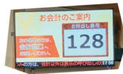
会計のご案内もバッチリ！

カルテの運搬や検索時間の減少に加え、医療情報は予想以上に同じ内容を転記することが多く一つのことを2枚以上の用紙に書くこともあり、これらが減ることにより、その時間をより新たなサービスや患者さんへの対応にあてることが可能となります。