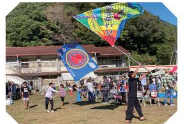
勝賀瀬秋祭りで地元の方と交流