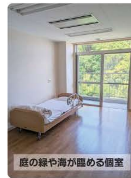
庭の緑や海が臨める個室