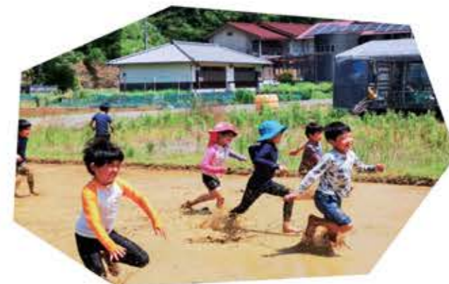
元気にどろんこ遊び