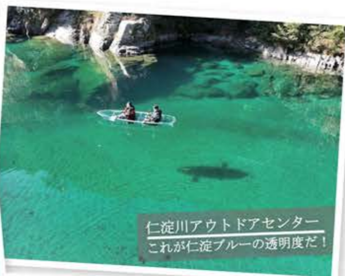
仁淀川アウトドアセンター これが仁淀ブルーの透明度だ!