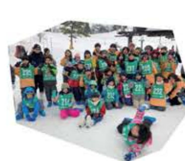
大山でのスキー合宿